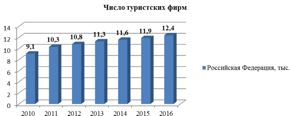
Рис. 2. Число туристских фирм Российской Федерации (визуализировано авторами по данным Росстата)

Сокращение числа реализованных населению турпакетов можно объяснить тем, что согласно данным таблицы 4, произошло сокращение выездного потока и переориентация высвободившихся потоков на внутренний рынок. Большинство зарубежных туров, проданных населению, приобреталось в качестве пакетных туристских поездок.