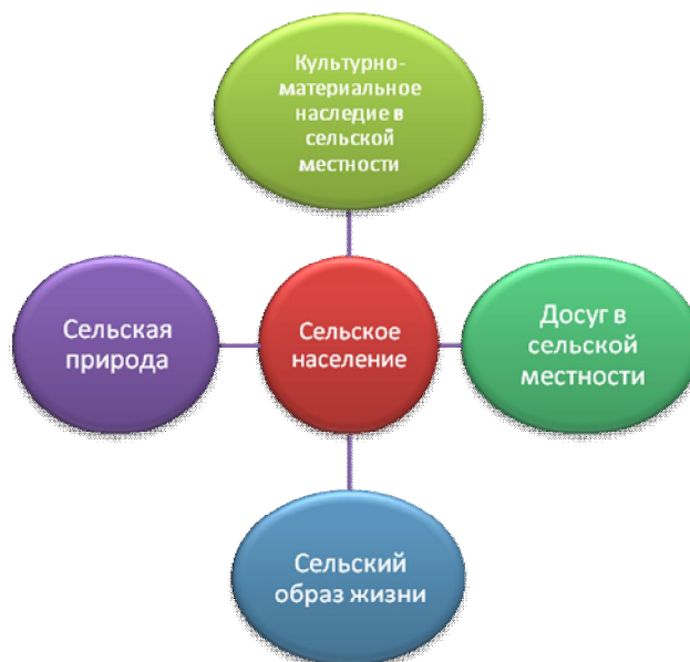
Рис. 1. Универсальная модель сельского туризма Всемирной туристской организации.

Можно выделить следующие цели агротуризма: