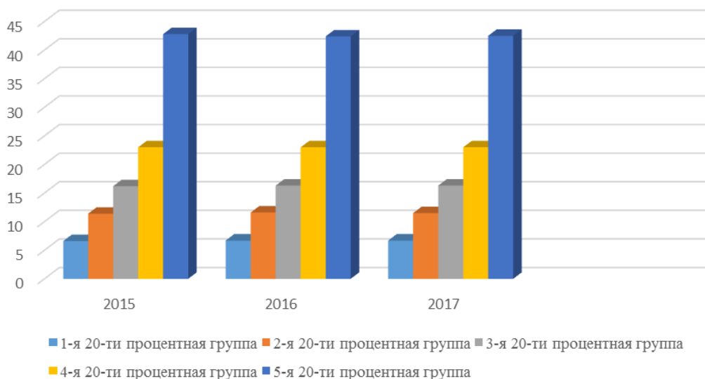
Рис. 3. Удельный вес доходов 20-ти процентных групп населения КЧР в 2015-2017 годы, в % от общего объема денежных доходов [выполнен автором, 4]

В 2015 году наблюдается большой разрыв между денежными доходами 20-ти процентами группы с наименьшими доходами и 20-ти процентами группы с наибольшими доходами по сравнению с 2017 годом, соответственно 10,7 и 10,5. Это произошло вследствие увеличения в 2017 году по сравнению с 2015 годом доли первой группы с наименьшими доходами на 0,1%, а также уменьшением в 2017 году по сравнению с 2015 годом доли пятой группы с наибольшими доходами на 0,3%.